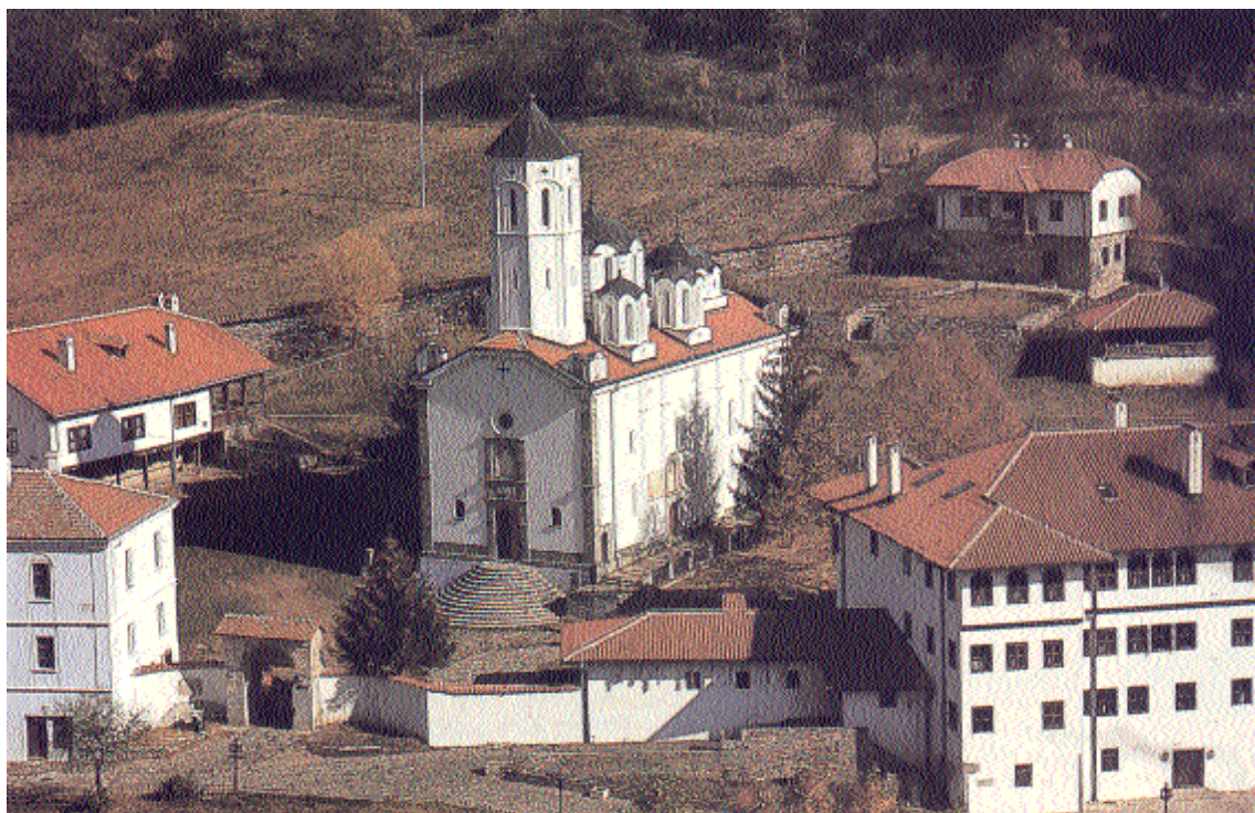
Obnovljeni manastir Sv. Prohor Pčinjski

U podnožju planine Kozjak, na krajnjem jugu Srbije, u blizini granične linije sa Makedonijom, nalazi se čuveni srpski manastir Sveti Prohor Pčinjski . Čuven zbog svoje duge i burne prošlosti, zbog značenja koje je imao, a i danas ima, u narodu. Uz sve to, manastir Svetog Prohora neodoljivo privlači svojom živopisnom okolinom. Smešten je u kanjonu gornjeg toka reke Pčinje, jedne od najdužih i vodama najbogatijih pritoka