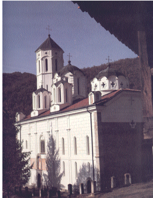
Hram sv. Prohora Pčinjskog

O manastiru Sveti Prohor Pčinjski ima dosta podataka i u turskim pisanim izvorima. Oni su s vremena na vreme organizovali popise, pa su tako već s početka XVI veka izveštavali o monaškom životu u ovom manastiru. Krajem XVII veka, kako beleže i turski izvori, na čelu manastira bio je iguman Ilarion . Zahvaljujući njemu monaški život