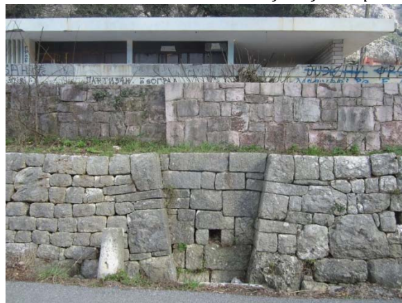
Objekat u okviru kompleksa Auto-kampa kao karakterističan primjer arhitekture XX vijeka