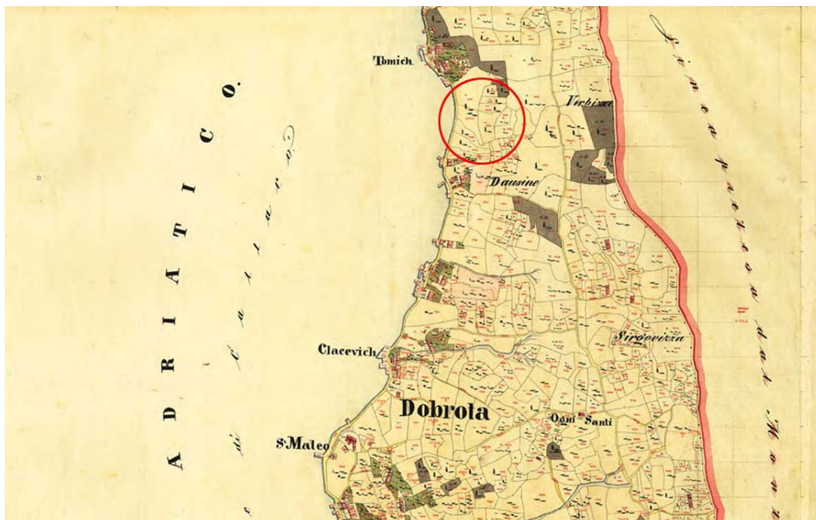
Izvod iz katastarskog plana iz 1838.godine na kome je označena lokacija Auto-kampa i na kome se vidi karakteristična struktura naselja Dobrota sa grupacijama kuća i kultivisanim terasastim imanjima između njih