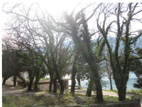
Kompleks Auto-kampa sa terasastim parcelama, kamenim podzidima i stablima hratova