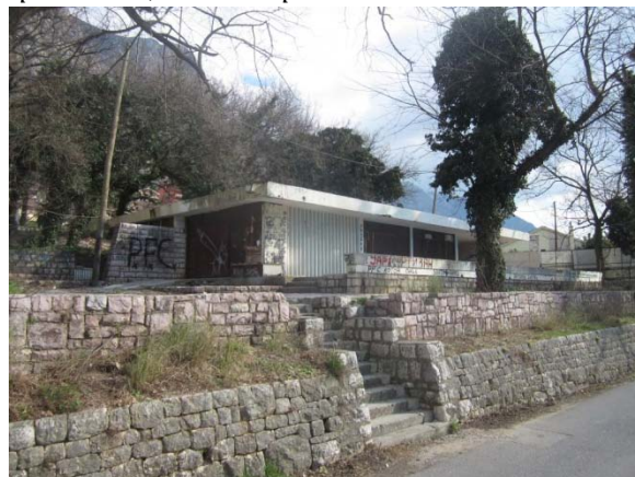
Veoma kvalitetno urbanističko rješenje kompleksa