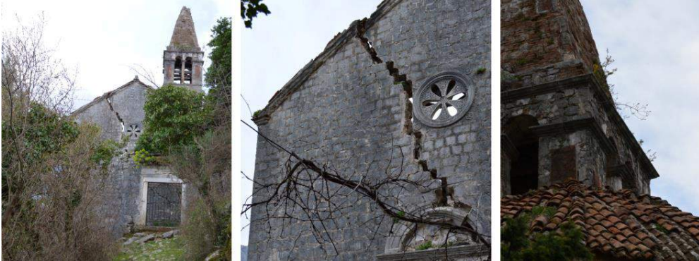
Slika br. 3: Crkve u Gornjem Prčnju

- Na sličan način, zabrinuti smo za stanje Kulturnog pejzaža u cjelini, koji je jako važan za OUV UNESCO-vog područja svjetske baštine. Na primjer, starim maslinjacima se trenutno pridaje vrlo malo pažnje. (vidjeti sliku br.4)