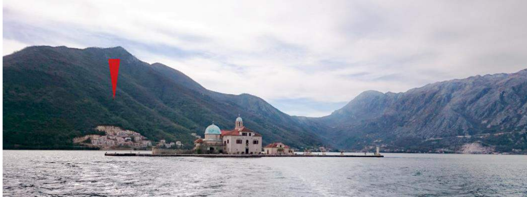
Slika br. 3: Izgrađeno naselje u Kostanjici koje vidno narušava OUV područja svjetske baštine

Preporuka: Predlažemo da se HIA iskoristi za pronalaženje alternativnih rješenja za most na Verigama. Dobili smo informaciju da je razrađeno već nekoliko planova koji u sebi sadrže integrisane i održive saobraćajne programe za cijeli zaliv. Predlažemo da se UNESCO informiše o ovim planovima da bi im se pokazalo da potencijalne alternative postoje. Takođe predlažemo da HIA sadrži i potpunu studiju opcije tunela na Verigama. Ovo je važna tema jer su nedavni primjeri već pokazali da je izgradnja puteva u Bokokotorskom zalivu tehnički komplikovana zbog ekstremno komplikovanih topografskih uslova. Obimnije strukturalne intervencije su neophodne, poput nasipa, tunela i mostova, koje bi lako mogle da naruše ekstremno osjetljivi kulturni pejzaž ovog UNESCO-vog područja svjetske baštine (vidjeti sliku br. 2).