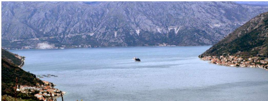
Slika br. 2: Put iz Lipaca ka sjeveru

Preporuka: Predlažemo da se HIA iskoristi za pronalaženje alternativnih rješenja za most na Verigama. Dobili smo informaciju da je razrađeno već nekoliko planova koji u sebi sadrže integrisane i održive saobraćajne programe za cijeli zaliv. Predlažemo da se UNESCO informiše o ovim planovima da bi im se pokazalo da potencijalne alternative postoje. Takođe predlažemo da HIA sadrži i potpunu studiju opcije tunela na Verigama. Ovo je važna tema jer su nedavni primjeri već pokazali da je izgradnja puteva u Bokokotorskom zalivu tehnički komplikovana zbog ekstremno komplikovanih topografskih uslova. Obimnije strukturalne intervencije su neophodne, poput nasipa, tunela i mostova, koje bi lako mogle da naruše ekstremno osjetljivi kulturni pejzaž ovog UNESCO-vog područja svjetske baštine (vidjeti sliku br. 2).