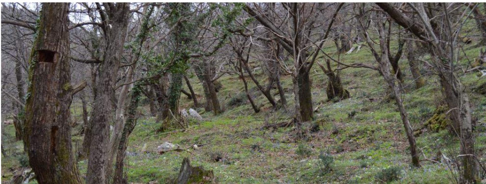
Slika br. 4: Maslinjaci u Gornjem Stolivu

Preporuka: Već postoji puno informacija o lokalnim vrijednostima; međutim, važni elementi koji odražavaju OUV kulturnog pejzaža zaliva (takozvani atributi) još uvijek nijesu identifikovani na pravi način. Po našem mišljenju važno je iskoristiti proces izrade HIA da bi se ovi atributi identifikovali. Zatim, područja gdje izgradnja može da se obavi “bezbjedno” (zelena i crvena područja) mogu se odrediti, tako da se procesi planiranja i izgradnje prilagode OUV. Rezultat toga je obezbjeđivanje održivog razvoja u budućnosti.