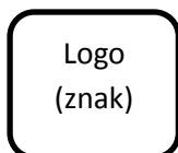
ŠKOLA I GRAD

Rješenje koncipirati kao LOGO (znak) uz koji će se upisivati naziv projekta na crnogorskom i engleskom jeziku , što je predstavljeno na skici dolje. Pozicija naziva projekta u odnosu na LOGO (znak), odnosi elemenata, boje itd. ostavljeni su na promišljanje autorima/kama.